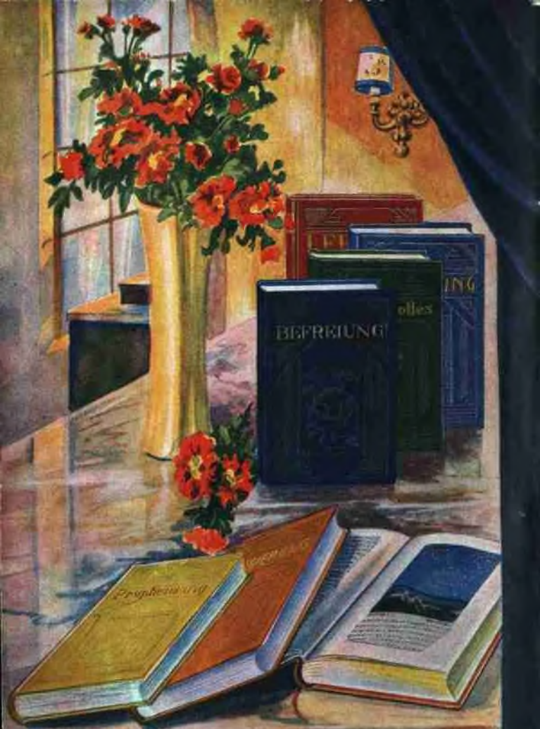
Richter Rutherford's sieben bemerkenswerteste Bücher (siehe Seite 63)