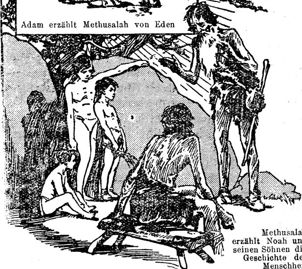
Methusalah erzählt Noah und seinen Söhnen die Geschichte der Menschheit