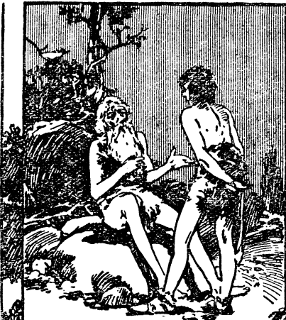
Adam erzählt Methusalah von Eden